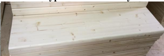
Ступень сорт АВ